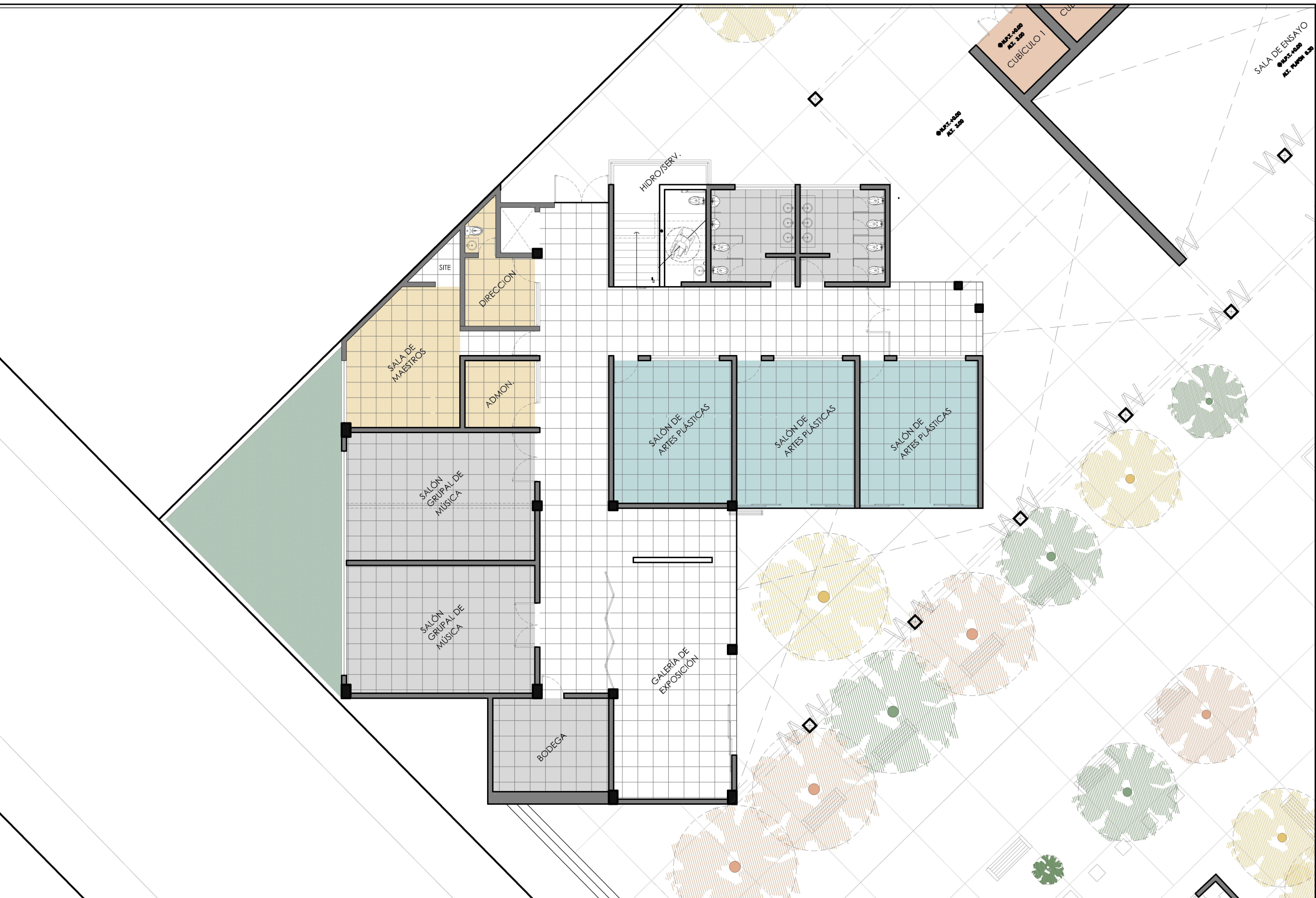
1 Planta baja Etc. 1:250